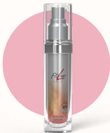
FitLine skin Activize Serum