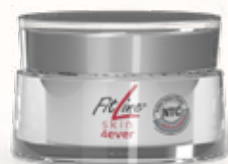
FitLine skin 4ever